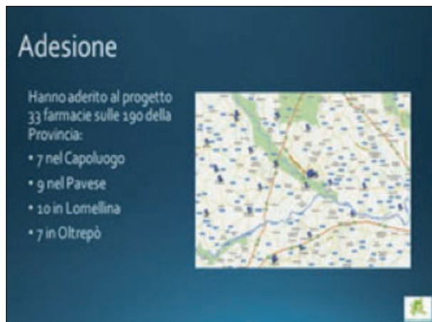
Figura 2. Hanno aderito al Progetto Pilota 33 (7 a PV, 9 nel Pavese, 10 in Lomellina, 7 in Oltrepò)

Le risposte rappresentano il punto di partenza del PDT di ciascun paziente arruolato. In 33 Farmacie della Provincia (Figura 2) sono stati così reclutati 199 pazienti, successivamente sottoposti ad una intervista telefonica da parte di specialisti del Centro Cefalee di Pavia (Questionario ad hoc ); 73/272 schede compilate non sono state prese in considerazione (<18->60 aa/ rinuncia/mancato contatto). Tutti i 199 pazienti reclutati (77% donne e 23% uomini) sono stati visitati al Centro Cefalee del Mondino e controllati dopo 3, 6, 12 mesi. Alla prima osservazione i pazienti, oltre a ricevere indicazioni in merito alla gestione del proprio disturbo, sono stati invitati a monitorare il consumo di farmaci anticefalalgici (v. Carta Diario, Figura 3).